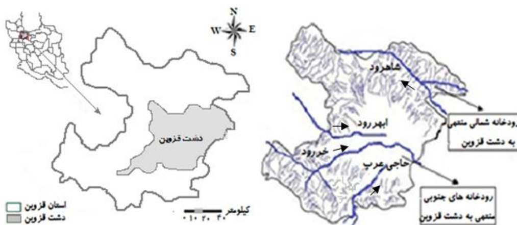
شکل ۱. موقعیت منطقه مورد مطالعه و جریان‌ات آب سطحی در آن

همراه داشته است (شرکت آب منطقه‌ای استان قزوین، ۱۳۹۰؛ پرهیزکاری و صبوحی، ۱۳۹۲). افزایش دمای هوا و کاهش بارندگی طی سال‌های اخیر در دشت قزوین از یک سو و افزایش سطح زیرکشت محصولات آبی برای تأمین غذای جمعیت در حال رشد، حفر چاه‌های غیرمجاز و برداشت بی‌رویه از آب‌های زیرزمینی در این دشت از سوی دیگر، ایجاب می‌کند تا مدیریت تقاضای آب بیش از گذشته مورد توجه قرار گیرد (پرهیزکاری، ۱۳۹۲). به‌طور کلی، از آنجایی که دشت قزوین در تولید محصولات کشاورزی و درآمدزایی استان قزوین و استان‌های هم‌جوار آن (تهران، البرز، زنجان، مازندران و گیلان) اهمیت ویژه‌ای دارد، توجه به مسئله حفاظت و پایداری منابع آب (به‌ویژه آب‌های زیرزمینی) در آن امری ضروری و مهم به نظر می‌رسد.