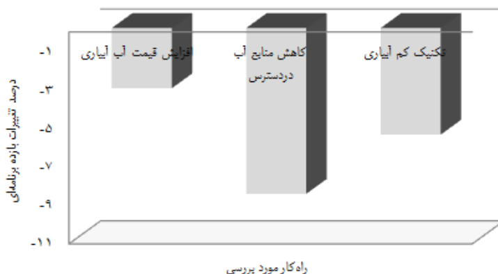
شکل ۳- مقایسه تغییرات بازده برنامه‌ای مربوط به راه کارهای مورد بررسی

همکاران (۲۰۱۱)، مشتاق و مقدسی (۲۰۱۲) و هوویت و همکاران (۲۰۱۲) در خارج از کشور است.