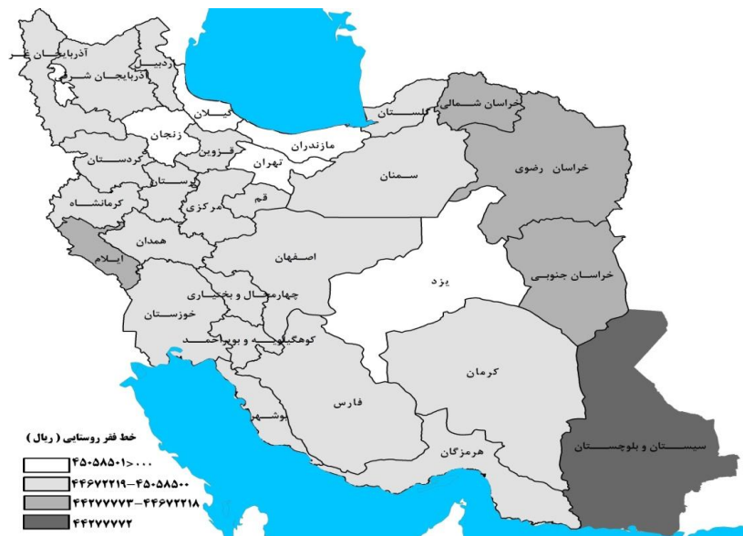
شکل 3- نقشه جغرافیایی خط فقر کشور در سال 1390

شکل 3، وضعیت خط فقر در مناطق روستایی استان‌های کشور را برای سال 1390 نشان می‌دهد. همان‌گونه که مشاهده می‌شود، خط فقر در روستاهای استان سیستان و بلوچستان کمترین مقدار و در روستاهای استان‌های تهران، گیلان، مازندران، زنجان، یزد و قم بیشترین مقدار را دارد.