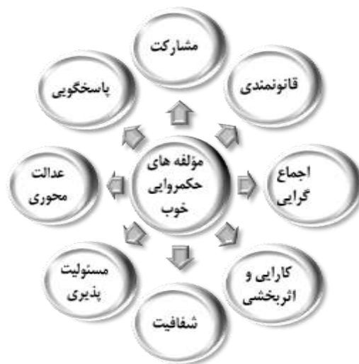
شکل ۱. مؤلفه‌های حکمروایی خوب روستایی