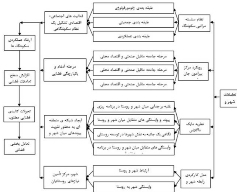
شکل ۲. مدل مفهومی تحقیق

هورامان) جزء شهرستان سروآباد دارای مساحت ۲۲۵ کیلومتر مربع بین، 35^{\circ} درجه و 06' دقیقه تا 35^{\circ} درجه و 16' دقیقه عرض شمالی و 46^{\circ} درجه 10' دقیقه تا 46^{\circ} درجه و 26' دقیقه طول شرقی از نصف‌النهار گرینویچ واقع است. این بخش طبق سرشماری عمومی نفوس و مسکن در سال ۱۳۹۵، دارای دو دهستان (اورامان تخت و شالیار)، یک نقطه شهری (شهر اورامان تخت)، ۱۱ روستای دارای سکنه، ۳ روستای خالی از سکنه، ۲۴۴۵ خانوار و ۸۵۶۶ نفر جمعیت بوده است.